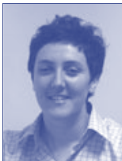
Nicola Ní Chearra Oifigeach Cúirte