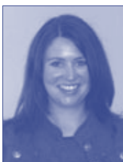
Gráinne Nic Ghiolla Oifigeach Cúirte